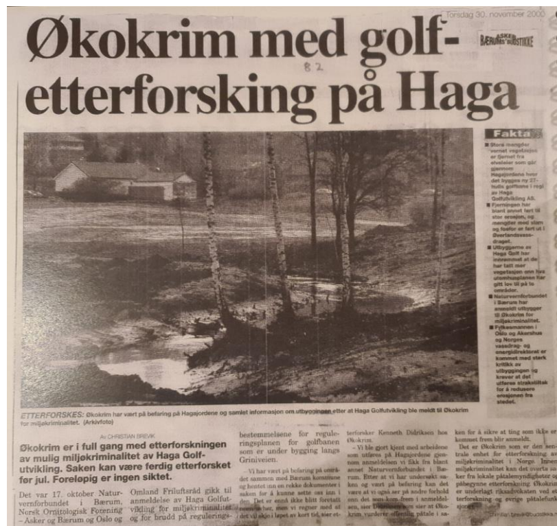
Asker & Bærum Budstikke 30. november 2000

arbeidslag og mange maskiner gående på jordene, og han så for seg de økonomiske konsekvensene av å stoppe arbeidet mens etterforskningen pågikk. Han klarte å få til et møte med ordføreren i kommunen og fikk en midlertidig godkjenning til å fortsette arbeidet på tross av saksutredning. Den 2.oktober 2001 ble saken henlagt på grunn av bevisets stilling. 7